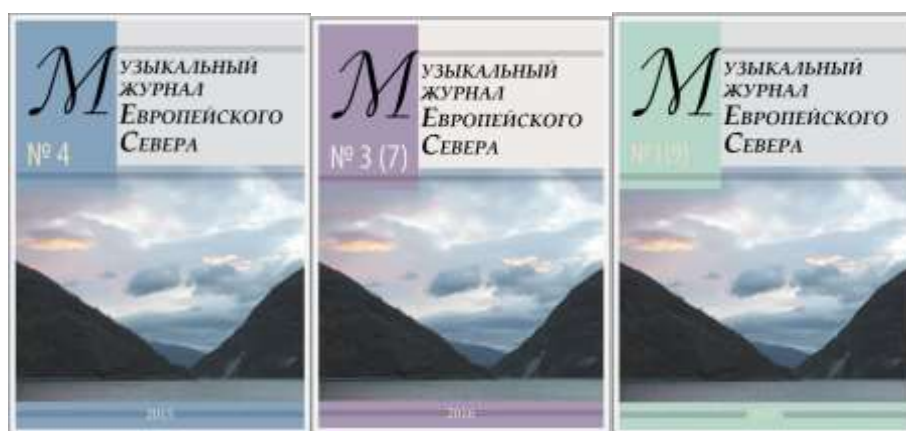
Электронный научный журнал Петрозаводской консерватории «Музыкальный журнал Европейского Севера» (проект «Музыкальная традиция Северной Карелии», 2013)