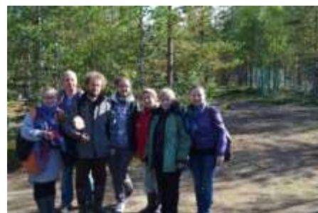
Экспедиции в Мурманскую область и страны Северной Европы (проект «Музыкальная традиция саамов Кольского полуострова», 2012).

Несмотря на то, что интерес к саамской теме никогда не угасал – ей посвящены многочисленные этнографические очерки, статьи, заметки исследователей и путешественников, когда-либо посещавших край, – к изучению музыкальной культуры саамов учёные до сих пор обращаются редко. Сегодня этническую музыку саамов Кольского полуострова планомерно изучают лишь карельские исследователи. Их интерес объясняется, в частности, наличием факторов и явлений, связанных с историческим контекстом проживания саамского народа в прошлом на территории региона, и обусловлен присутствием этнолингвистических и этномузыкальных реликтов в традиционных культурах коренных финно-угорских народов. В связи с этим, своеобразным продолжением реализованного проекта является научно-исследовательская работа, направленная на изучение этнической музыки саамов Кольского полуострова в контексте этномузыкальных культур