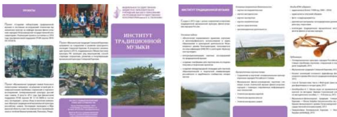
Буклет о деятельности Института традиционной музыки Петрозаводской консерватории

Одним из первых проектов 5 Петрозаводской консерватории, поддержанных Российским гуманитарным научным фондом, было «Создание лаборатории традиционной музыки и системных исследований этнических музыкальных культур». Собственно, Институт был создан в 2013 году на базе Лаборатории традиционной музыки.